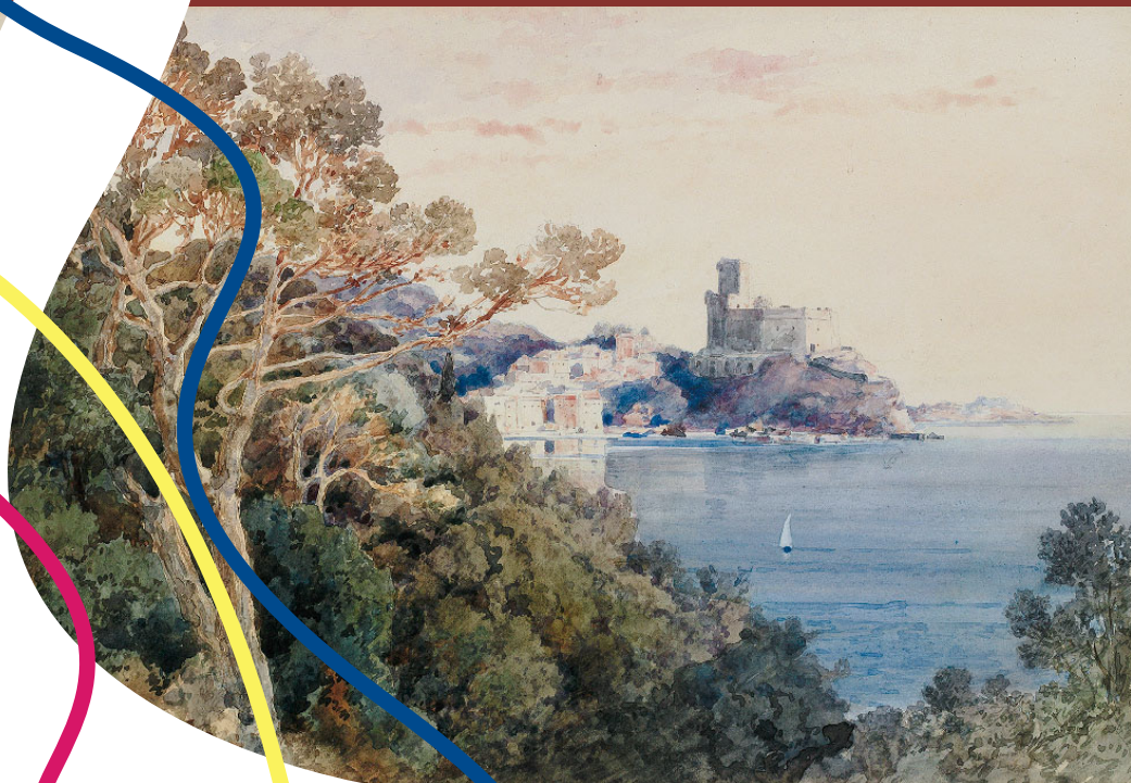
Johann Gottfried Steffan, Lerici 1900, acquerello