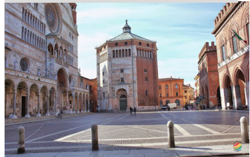
Cremona 7-8 novembre 2017 Congresso Nazionale GISCoR