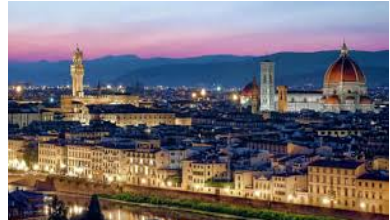
Firenze, 11-12 novembre 2016 Congresso Nazionale GISCoR