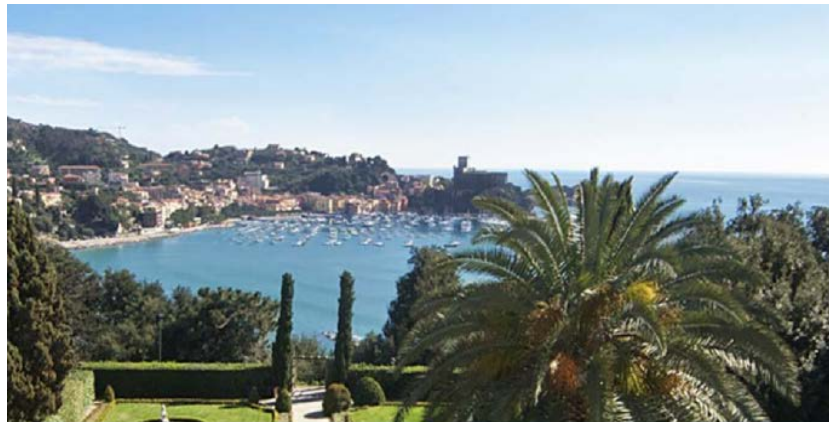
XIII Congresso Nazionale GISCoR Lerici, 25-26 ottobre 2018 Villa Marigola