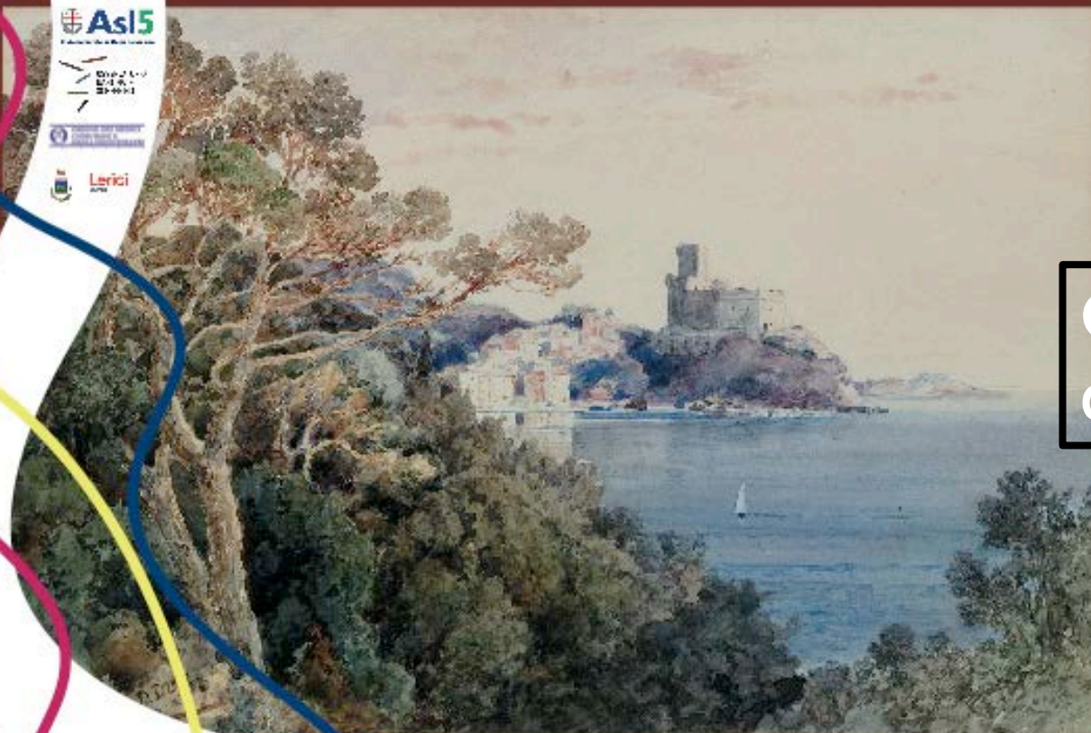
Johann Gottfried Steffan, Lerici 1900, acquerello