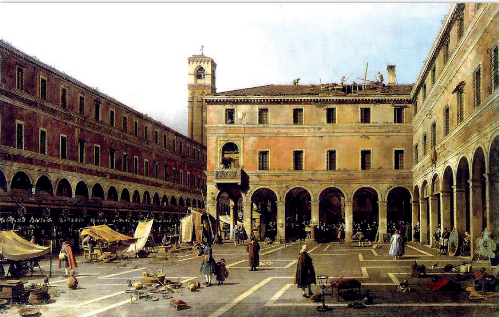
Chiesa dei santi Giovanni e Paolo con la scuola di San Marco, Canaletto 1725, Gemaldegalerie, Dresden

RE-INGEGNERIZZAZIONE DELLA PREVENZIONE INDIVIDUALE E PROGRAMMI DI SCREENING: EFFICACIA, QUALITÀ E SOSTENIBILITÀ