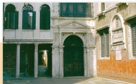
Venezia – Scuola Grande San Giovanni Evangelista Esterno

IOV – Istituto Oncologico Veneto Regione Veneto